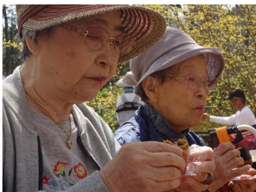
花より団子🍡 食べる時は無我夢中(^^)

くるみでは今年も花見に来ることができたことに感謝しながら、もう次のお出かけの話に花が咲いています！❀