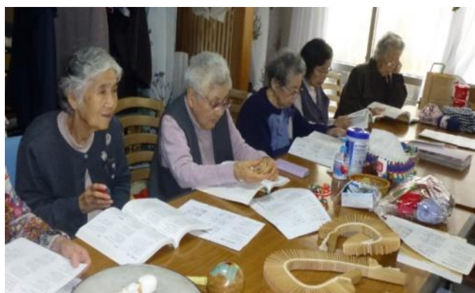
なつかしバンドの皆さんとうたいます。

笑うという事は、脳を活性化させ、記憶力が増す、など脳の機能を知らない内に向上させています。サロンは、介護保険に関係なくどなたでも参加していただけます。