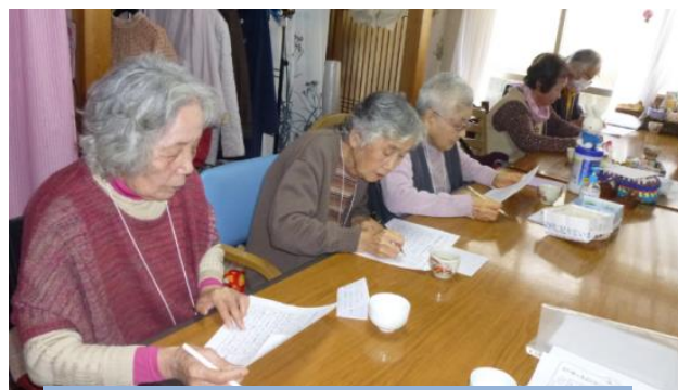
サンサン体操 この問題難しい

サンサン体操では、いつも变りなく出来ている指の運動ですが、時々「イヤ～間違えた～！」と言って笑いだす利用者さんにつられて他の皆さんも笑い出します。「自分の事で一生懸命だから黙っていれば、わかりませんよ。」と言うと、他の利用者さんが「正直やな～」と言っては又、笑い出すと言う光景がよくあります。