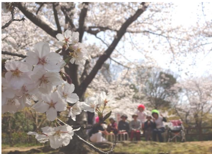
今年の桜もきれいでした。満開♡

くるみでの重心を意識した姿勢や運動は、生活の中のちょっとした楽しみにつながっています。今回も、今まで車いすで参加してくださっていた方が、スタッフの介助で立つことができました。たまたま通りがかった方が写真を撮ろうと言ってくださり、その間もずっと土の地面に足をつけて立ってくださいました。その時に立てたご本人も、一緒にいた皆さんもとても喜んでくださったことが印象的です。