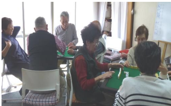
麻雀サロン 頑張ります

色々な花達が咲き。私達を楽しませてくれます。「癒されるね」と言いながら、珍しい花など見てまわりました。