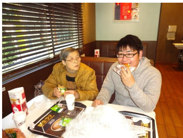
マクドナルドで違うメニューにも気になっています！(^_^;) あげませんけど

リハビリは「頑張る」というイメージがありますが、くるみは「ゆっくり・ゆったり・気持ちよく・楽しく」を大切にしています。そう思って頂ける空間づくりにスタッフは毎日一生懸命です。一緒に運動したり、おしゃべりしたり、真剣にゲームをしたり、ふざけたりしていると、いつの間にか他の方の喜びを自分の事の様に喜んでくださっていて、それを感じたスタッフも温か～い気持ちになります。