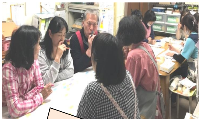
研修 どんな萌の里がいいのか？

みなさん高齢になられると、希望、やりたいこと、ついつい歳のせいにして、身体的な不具合で諦めてしまっていないですか？