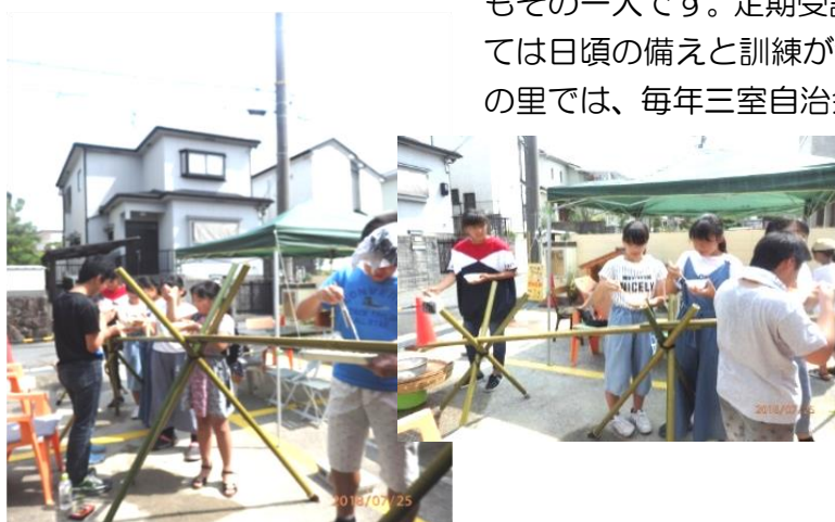
青空の下で 流しソーメンをしました

私だけは絶対大丈夫と言う心理だそうです。何の根拠もなく過去の経験や思い込みが邪魔をして判断を誤ってしまう事が多いそうです。災害のみならず病気においても言える事で今二人に一人が癌になると言われているにも拘わらず殆どの方が大丈夫だと思っています。私もその一人です。定期受診してまいります。災害時には日頃の備えと訓練が私達の身を守る第一の手立てです。萌の里では、毎年三室自治会、防犯、防災会、の協力を頂いて防