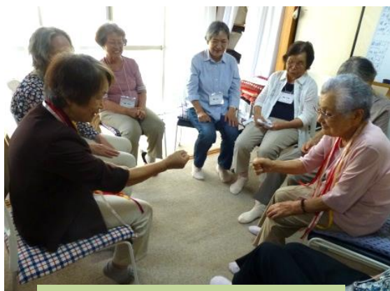
＊じゃんけんゲーム

これからも、サロンをご利用の皆さんが「今日も楽しかった!」と言ってくださるように頑張っていきたいと思います。