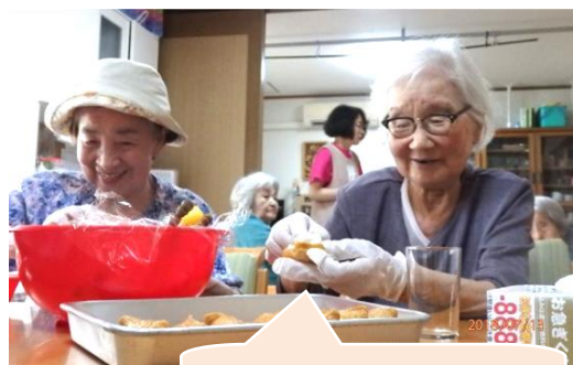
おいなりさんを作ります

私事ですが、高槻に住む友人は地震で屋根が崩れました。岡山真備の同窓生は2階まで浸水、いまだ避難生活を余儀なくされています。今までテレビ映像を見るだけでしたが身近にこのような事が起き他人事で