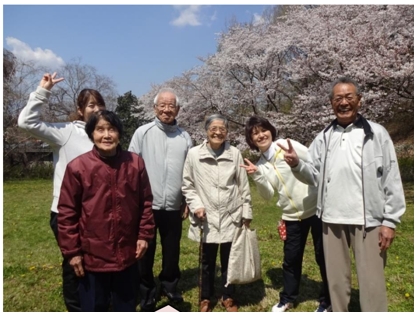
馬見公園でも満開🌸

車いすから降りて少し歩くと、それを見ている方もとても幸せそうな表情をしてくださいました。