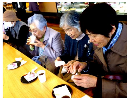
桜餅おいしいね！★天平庵にて

Bさん「うらやま しい。1人暮らし は掃除・洗濯・食 事全部しないと いけないよ。」