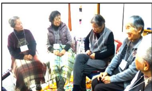
★サンサン体操 チョットおしゃべり