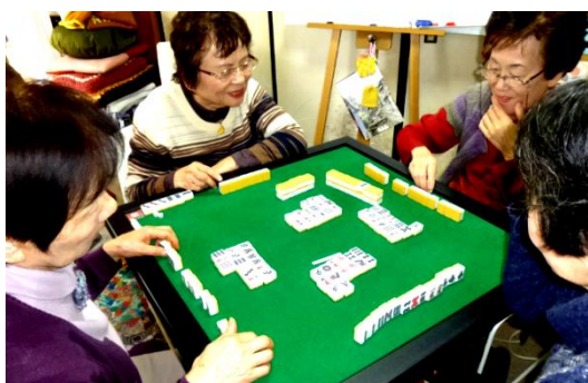
★麻雀 調子はいかがですか。

話がはずみます。皆さんそれぞれに思う事はたくさんあっても、サロンに来て自分の好 きな事をしながらみんなと気楽におしゃべりをして一日をすごしていただきます。皆さんの 賑やかな笑い声がいいのです。