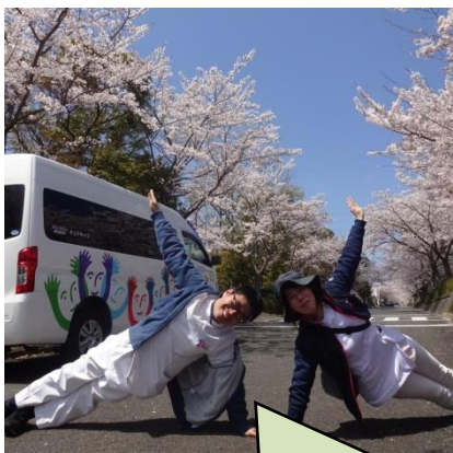
職員も楽しんでおります♡

くるみでは花見の日でも姿勢の測定をし、それぞれの目標も確認して、やりたいことに活かしていくという目的を持って出発です。