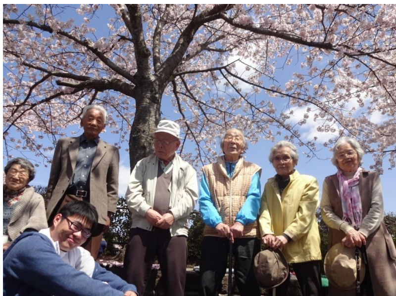
サンサンニュース用でーす！ハイチーズ📷

毎年お世話になる馬見公園も、高田川沿いの桜も、信貴山も、柏原方面も、今年も咲いたよと笑っているような、最高のもてなしをしてくれました。