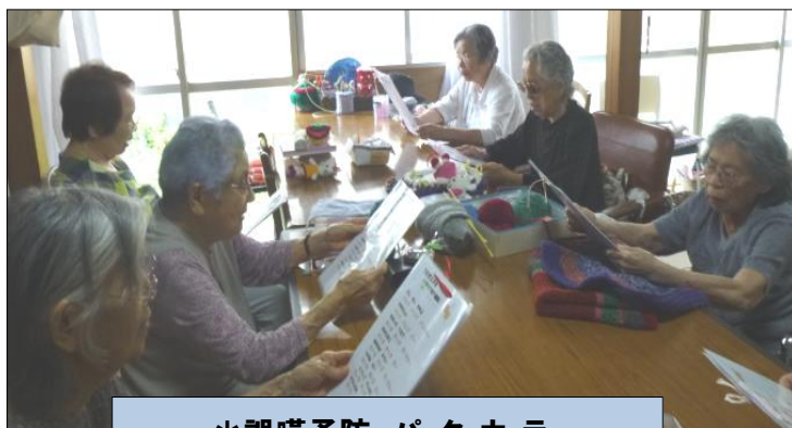
＊誤嚥予防 パ・タ・カ・ラ

月曜日・木曜日の手芸は、90代の方も増え、手の込んだ物はしなくなっても、編み物などをしながら、おしゃべりに夢中です。先日は、もち米を頂いたので餅つき機でお餅をつき、みんなできれいに丸め、アンコときな粉のお餅を作り、おやつに頂きました。