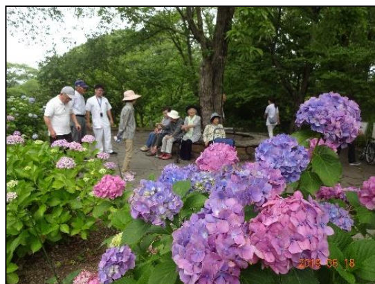
馬見公園のアジサイが満開でした！

普段は歩けない距離も、話しながらだと「歩けたわ！」という喜びの声も上がりました。頑張った私たちを色とりどりの紫陽花が迎えてくれました（＾＾）7月に梅雨明けとともに本格的な夏の到来！なのにくるみでは「どこ連れて行ってくれるのん？」と、暑さを感じられない頼もしい言葉が飛んでいます（笑）