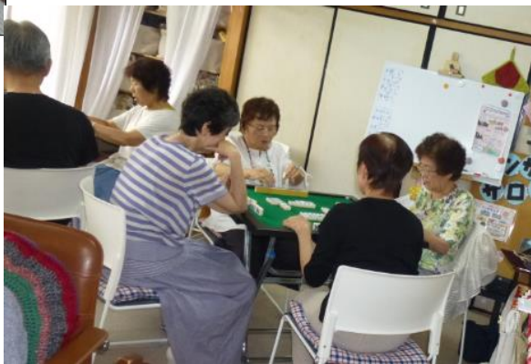
＊調子はいかがかな。

月曜日の麻雀サロンは、10時開始ですが、早くから来て準備万端整え、メンバーが揃えば、「さあ〜!頑張りましょう。」予想できないスリルや点数の高い役ができた時の満足感など味わいながら2時間楽しんで頂いています。