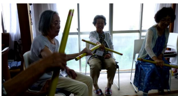
＊棒を使って転倒予防

を歌いながらのゲームや、記憶力を刺激させる為の指の運動などをしながら脳トレにはげんでいます。時にはおしゃべりに華が咲き、先に進まないこともあります。みなさんが楽しんで、笑って2時間がアッと言う間に過ぎていくのが何よりうれしいです。