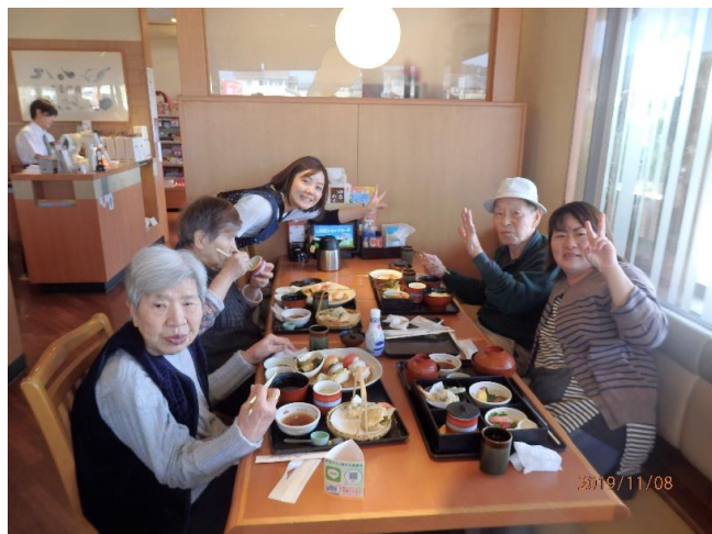
和食のさとでの外食

12 月 17 日に二年ぶりにお餅つきをしました。以前のように臼を出してつくことはできませんでしたが、文明の利器？餅つき機を使い丸める楽しさ、食べる喜びの「いいとこどり餅つき大会」を楽しみました。