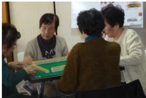
* 麻雀 頑張るよ！