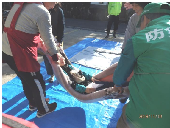
手製の担架での人命救助

ながら避難しました。担架の作り方や、負傷者のへの対応など、地域の方ともしもを考える有意義な時間となりました。日ごろから災害について考える大切さ、「お互い様」の思いで声をかけあえる関係づくりの必要性を身に染みて感じました。今後もスタッフで考え続けたいと思います。