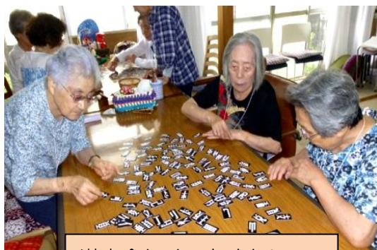
漢字合わせ むずかしい

不思議ですね、ちゃんと歌えます。今日も大きな声を出して元気に歌いながらゲームをしています。一度のぞいてみてください。楽しいですよ。