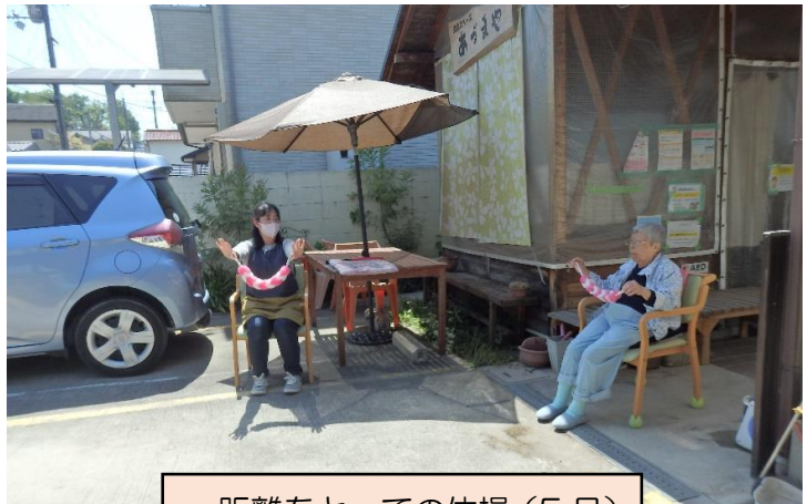
距離をとっての体操（5月）