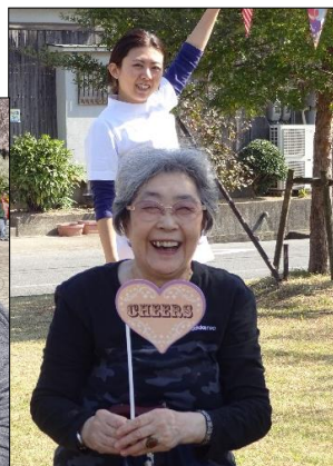
↑ マスクなしで出かけられた頃。